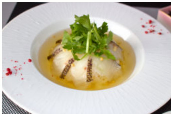
Garden風鯛茶漬 今が旬の鯛を贅沢にお茶漬けにしました 鯛だし香る春風のような澄んだ風味をお楽しみください 1,200円