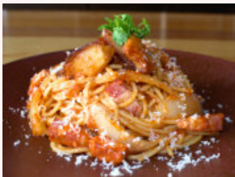
ベーコンと新じゃがいものアマトリチャーナ 1,000円