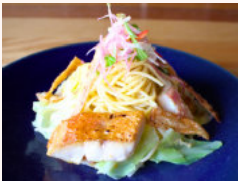
金目鯛と春キャベツの和風スパゲッティ 1,200円