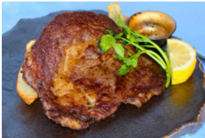
鹿角短角牛リブローズステーキ (300g) 特大300gステーキ！脂身が少ない牛肉は食べ応え抜群です ※数量限定 5,800円