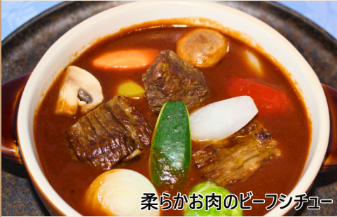
柔らかお肉のビーフシチュー